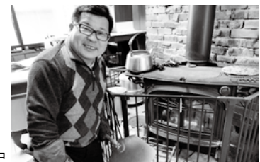
新ストーブで再生エネルギー実践中

「北栄町部落差別の解消の推進に関する条例」が制定されました。インターネットの発達などにより、人権に関する問題が複雑化・多様化している中で、国の部落差別解消推進法を受けて町の責務を明確にする条例制定です。モニタリングによる差別書き込みの削除要請や、相談・教育・啓発・支援の取り組み強化に努めるとの回答を得ました。