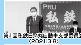
第1回私鉄日ノ丸自動車支部委員会 (2021.3.8)