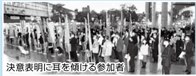
決意表明に耳を傾ける参加者