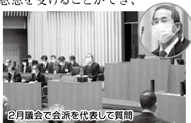
2月議会で会派を代表して質問