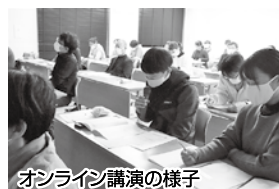
オンライン講演の様子