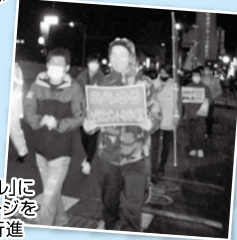
「シュプレヒコール」にあわせてメッセージを掲げながらデモ行進