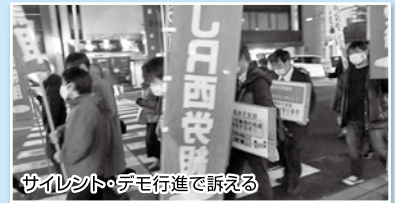
サイレント・デモ行進で訴える