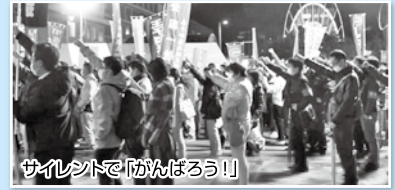
サイレントで「がんばろう！」